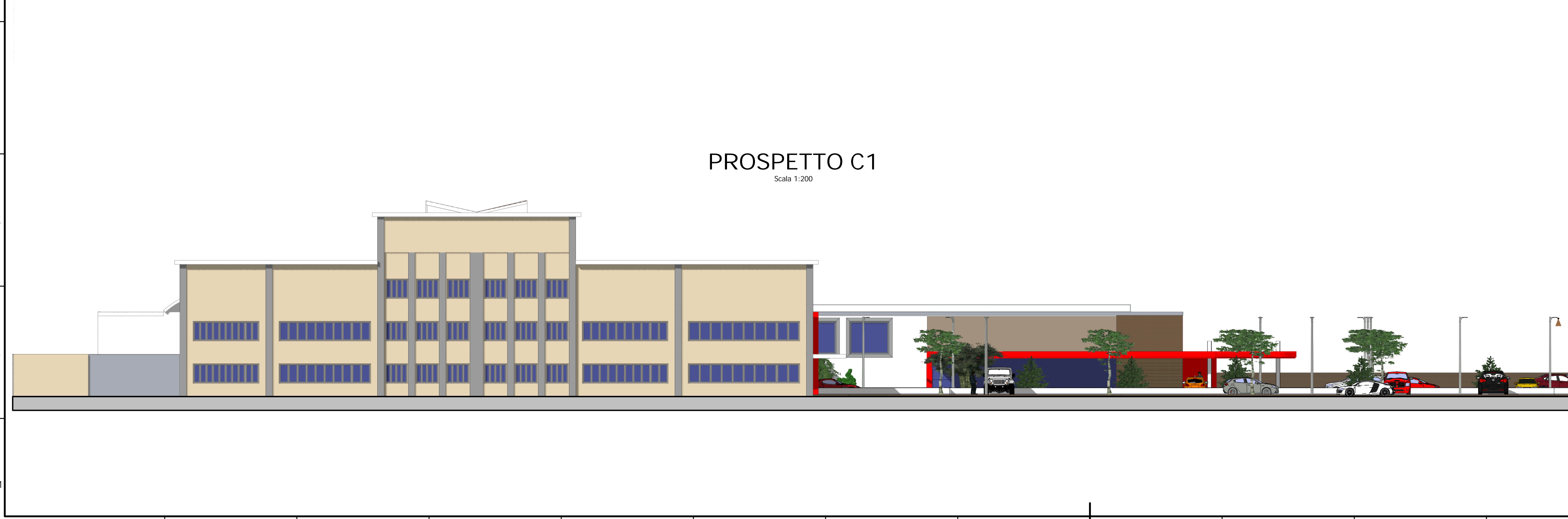
PROSPETTO C1 Scala 1:200