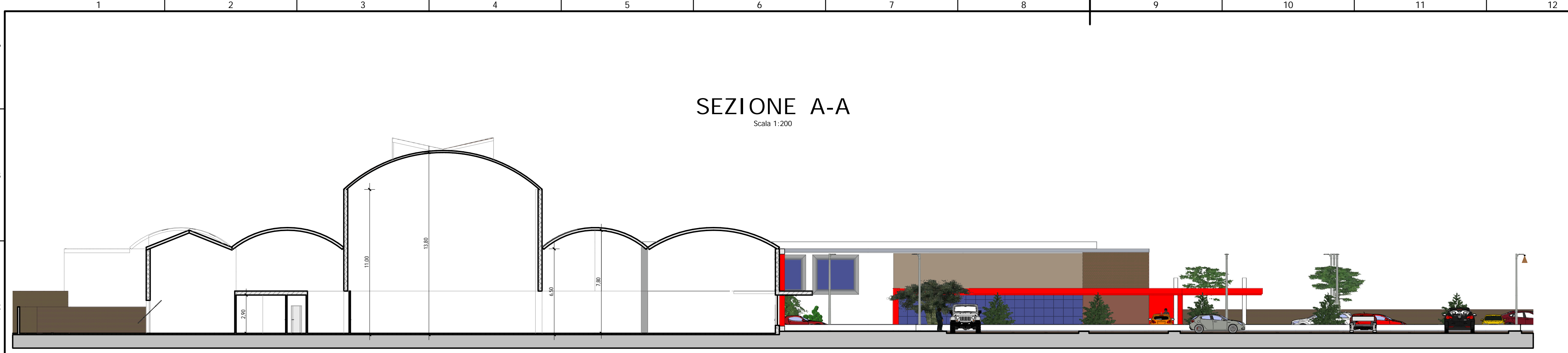
SEZIONE A-A Scala 1:200